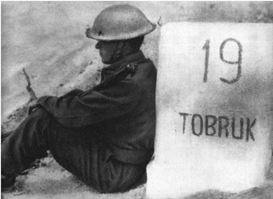
Pevňůstka S 19 „Honza „

Československé praporeční dílny se svými zbrojířmi a mechaniky se staly v Tobruku proslulou institucí. Mezi spojeneckými jednotkami se žertem říkalo, že stačí přinést Čechům kliku od auta a jistě k ní z ničeho nic přičarují vůz. Šikovnost českých rukou a vynalézavost myslí umožnila rozmnožit výzbroj a vybavení praporu a ještě opravit množství nejrůznějších, zejména kořistních zbraní pro jiné jednotky. Díky iniciativě svých vojáků disponoval 11. prapor 10. prosince 1941 již 653 puškami, 22 těžkými a 82 lehkými kulomety, 35 protitankovými puškami, 14 granátomety a 25 minomety, 3 protitankovými kanóny ráže 47 mm a dokonce i 4 houfnicemi ráže 100